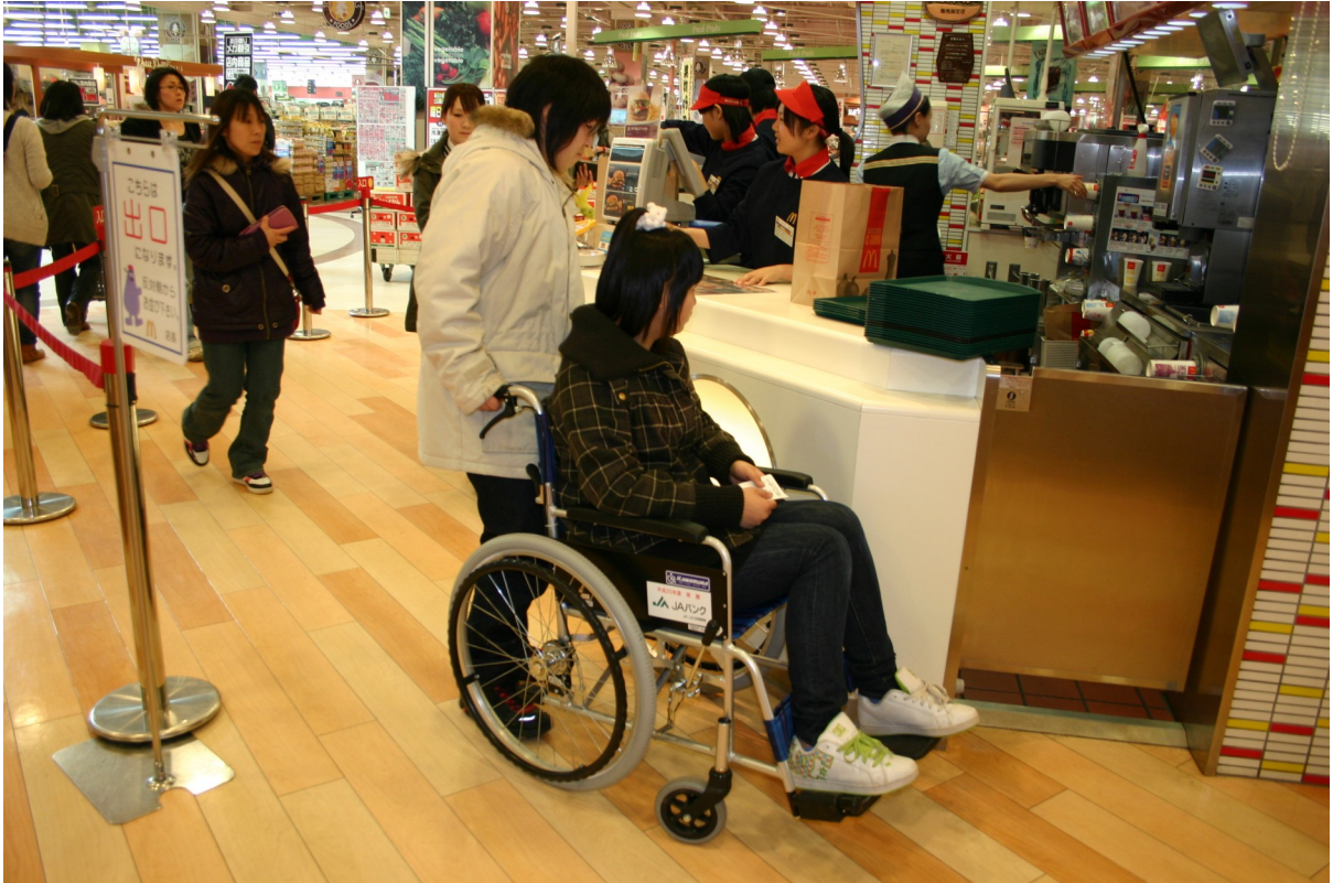
ちょっと体験ボランティア講座の様子。100cmの世界を体験しました。