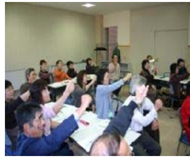
福祉レクリエーション講座