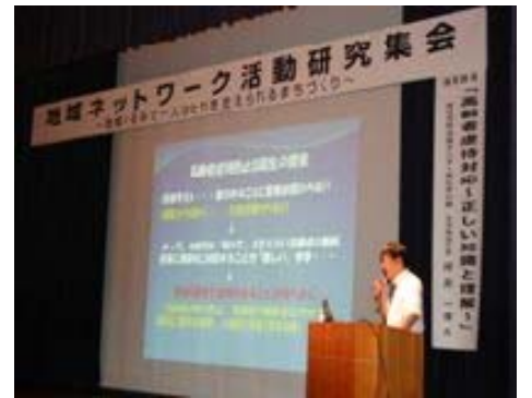
地域ネットワーク 活動研究集会