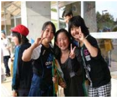
中標津小学校プラット見学