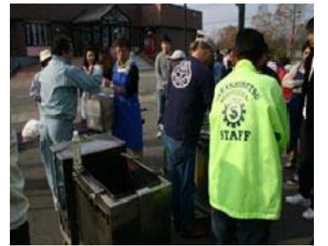
災害から考える地域の ネットワークづくり事業

皆様からご協力いただいた会費や寄付金は、地域福祉推進のための様々な事業に使わせていただいております。今後とも皆様からのあたたかいご理解とご協力をお願いいたします。 平成23年度決算、平成24年度予算は次のとおりとなっております。