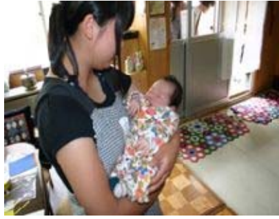
ちよつと体験 ボランティア講座