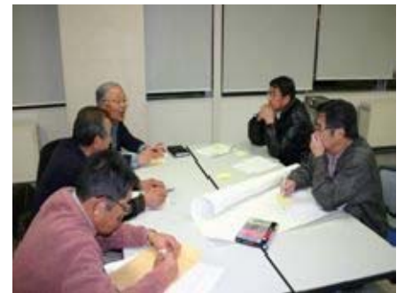
地域福祉リーダー養成講座