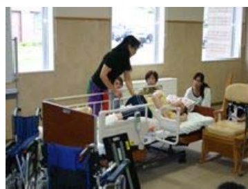
介護職員 キャリアアップ研修