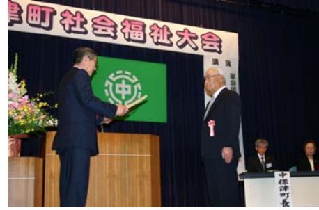
中標津町社会福祉大会