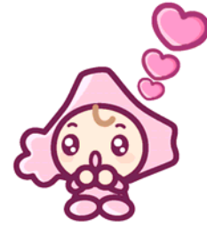
平成23年度決算 中標津町社会福祉協議会