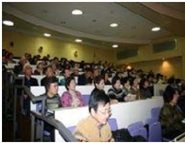
地域福祉セミナー