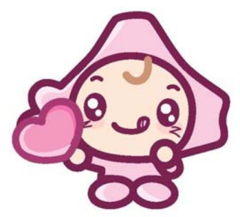
北海道内社会福祉協議会 イメージキャラクター 「ほっとちゃん」

○相談 事業の内容の説明を行い、本人の生活の状況をお聞きして、どのような支援を希望されているのか整理します。 ○利用契約、サービス提供 自立生活支援専門員が事業契約の意思確認を行い、その上で本人の生活状況に合った生活支援計画を作成し、利用契約を結びます。利用契約を結んだ後、生活支援計画に基づいた実際のサービスは生活支援員が行います。