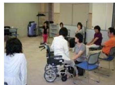
家族のための 在宅介護講座