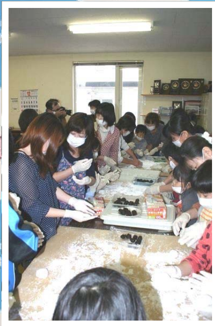
桜ヶ丘町内会 子供餅つき研修会