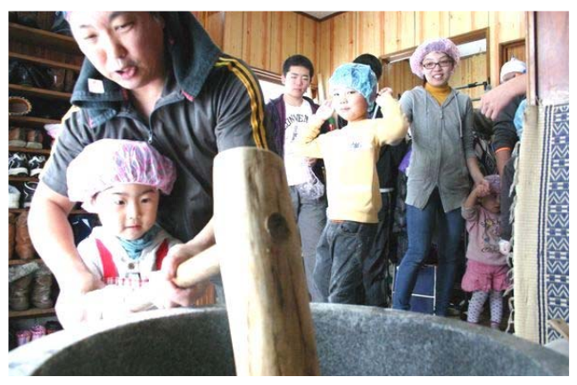
睦町内会 親子餅つき大会