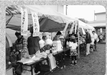
《緑町町内会 ふれあい祭り》 あいにくの空模様でしたが、子どもから お年寄りまで多くの人で賑わいました。