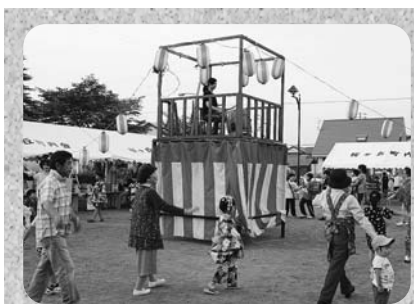
《桜ヶ丘町内会 親子夏祭り》 太鼓の音に合わせ、盆踊り♪ 皆さんとてもお上手でした。

各々の町内会のネーミングに特 色があり、内容も、餅まきや昔遊 びなど趣向を凝らし多くの方々 が参加され楽しんでいました。また 外の食事も一段と美味しく頂くこ とができ、皆さん笑顔でほおぼっ ていました。 このような町内会のイベントを 通じて、見守りやいざという時の 助け合いのための関係づくりが、よ り深まっていくことと思いました。 また、中標津町社会福祉協議会 では、町内会等身近な地域におけ る日々の繋がりの大切さについて 考えていただくための機会づくり を目的とした事業として、出前講 座を実施しておりますので、町内 会の皆様、是非お声かけください。