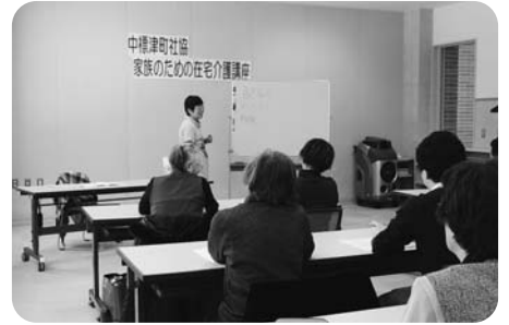
《家族のための在宅介護講座》