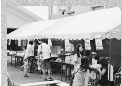
《いずみ中央ふれあい夏祭り》 「かたぬき」や「けん玉遊び」で子 どもたちもお祭りを満喫していました。