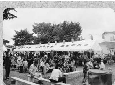
《南町町内会 夏祭り》 お天気にも恵まれ、中でも「餅 まき」が大盛況でした。

7月下旬から8月にかけて、夏 らしく暑い日が続いた中標津町で すが、町内の各町内会でも夏祭り などたくさんイベントが行われ ました。 その中からいくつかイベントの 様子をお伝えします。