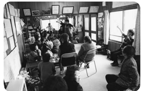
《ふれあいいきいきサロン活動の支援》

これらは「赤い羽根共同募金」を使わせていただき実施している事業、各種団体の活動の一例ですが、この他にも中標津町の福祉向上のために様々な活動を行っています。