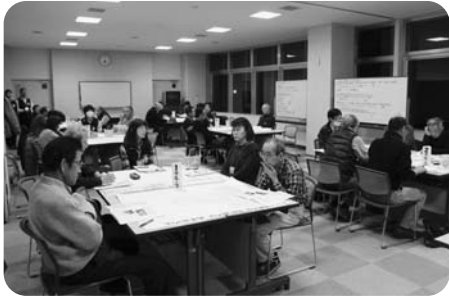
《地域福祉リーダー養成講座》