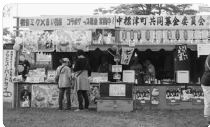
《募金額合計193,867円》 (うち販売益金98,814円)

金にいただいた金額に応じて初音ミク、日本ハムファイターズのグッズや中標津町限定オリジナルバッジをプレゼントし、飲食物の販売ではビールやつまみ等を販売し、益金は全て共同募金として寄付されました。今回赤い羽根共同募金に寄せられた募金や寄付金は、全道はもとより、中標津町内における福祉活動や事業に活用されています。