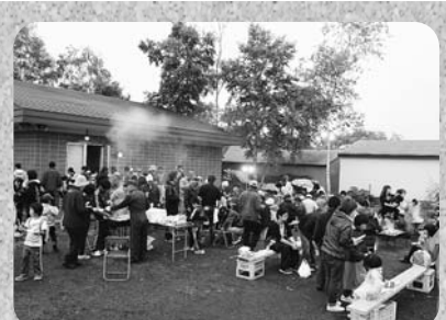
《白樺町内会サマーフェスタ》 おいしい焼肉を食べながら会話 も弾み、会場は大盛況でした。