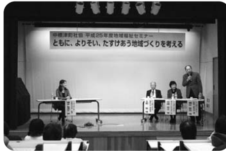
《地域福祉セミナー》