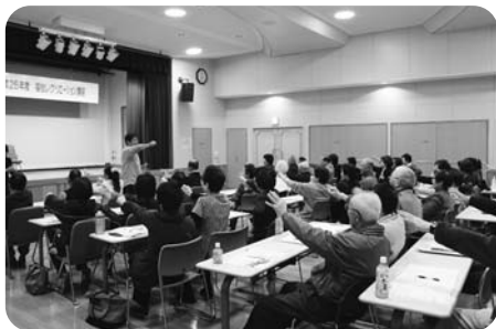
《福祉レクリエーション講座》