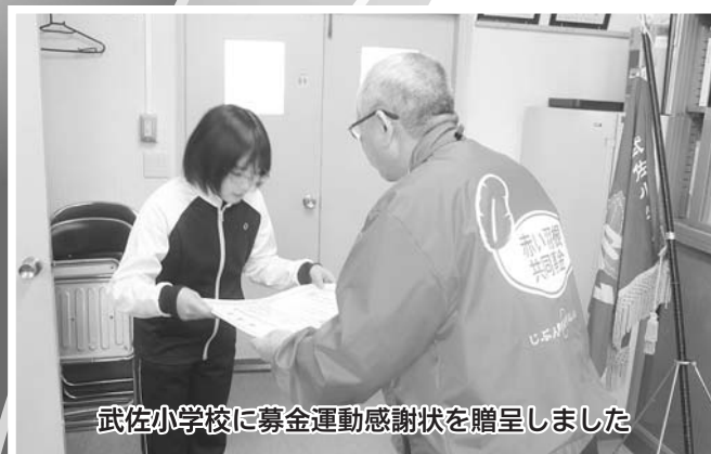
武佐小学校に募金運動感謝状を贈呈しました