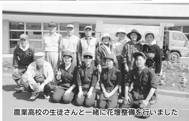
農業高校の生徒さんと一緒に花壇整備を行いました