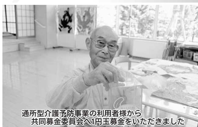
通所型介護予防事業の利用者様から 共同募金委員会へ1円玉募金をいただきました