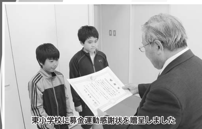
東小学校に募金運動感謝状を贈呈しました