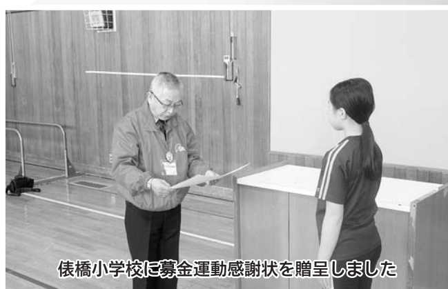
俵橋小学校に募金運動感謝状を贈呈しました