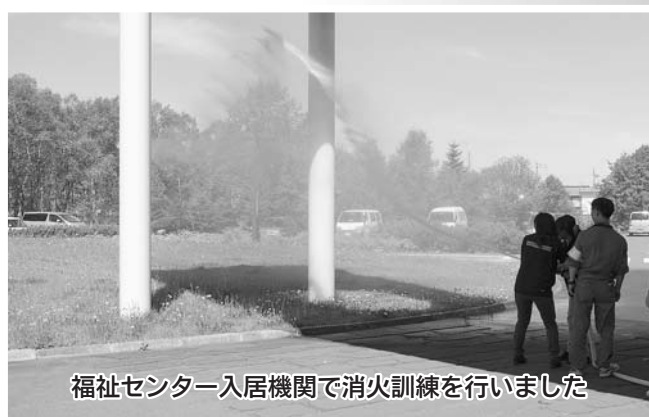
福祉センター入居機関で消火訓練を行いました