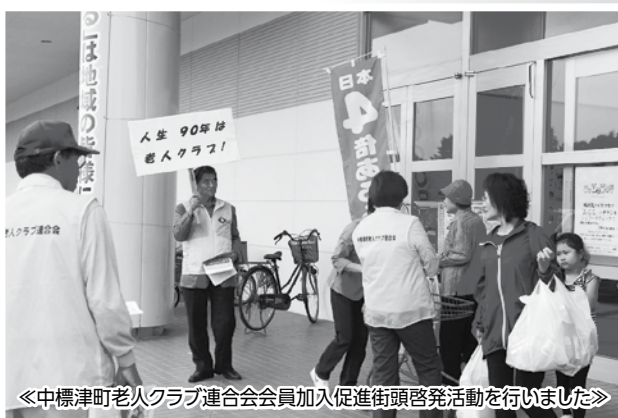
《中標津町老人クラブ連合会会員加入促進街頭啓発活動を行いました》