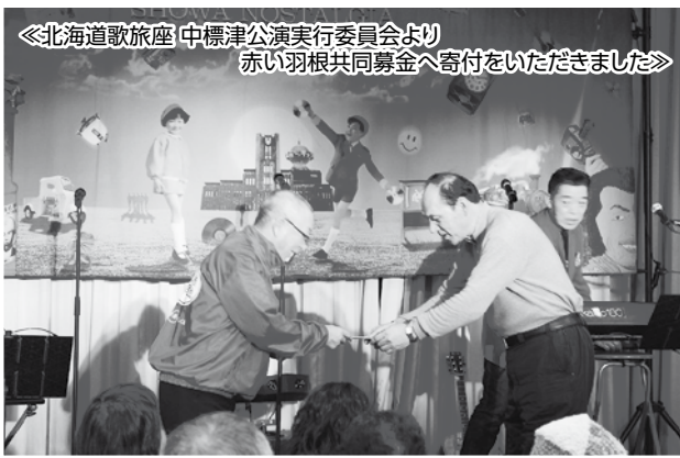
《北海道歌旅座 中標津公演実行委員会より 赤い羽根共同募金へ寄付をいただきました》