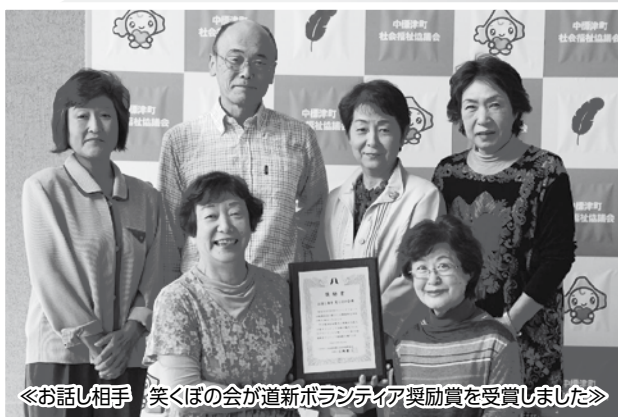
《お話し相手 笑ぼの会が道新ボランティア奨励賞を受賞しました》