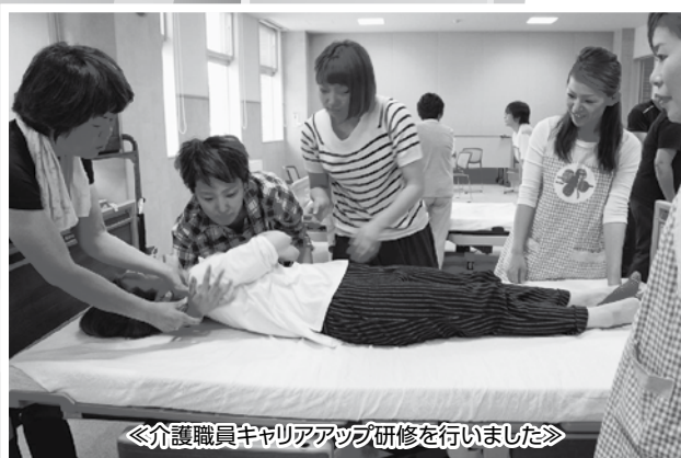
《介護職員キャリアアップ研修を行いました》