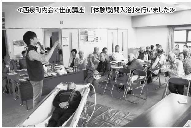
《西泉町内会で出前講座 「体験!訪問入浴」を行いました》