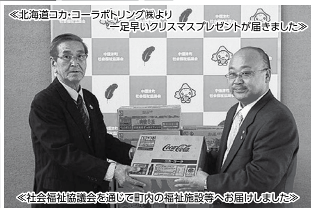
《北海道コカ・コーラボトリング様より 一足早いクリスマスプレゼントが届きました》