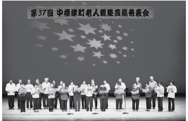
第37回 中標津町老人親睦芸能発表会

↑平成27年9月17日(木)中標津町総合文化会館において、第37回中標津町老人親睦芸能発表会を開催しました。(出演者320名/来場者600名)